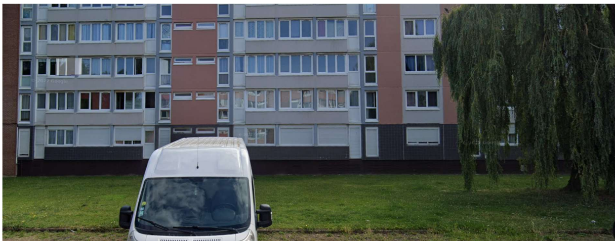
Espace du futur local vélo