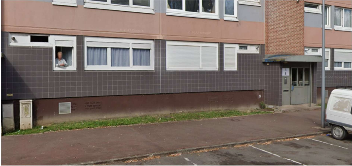
Exemple des délaissés, objets de la vente au bailleur.