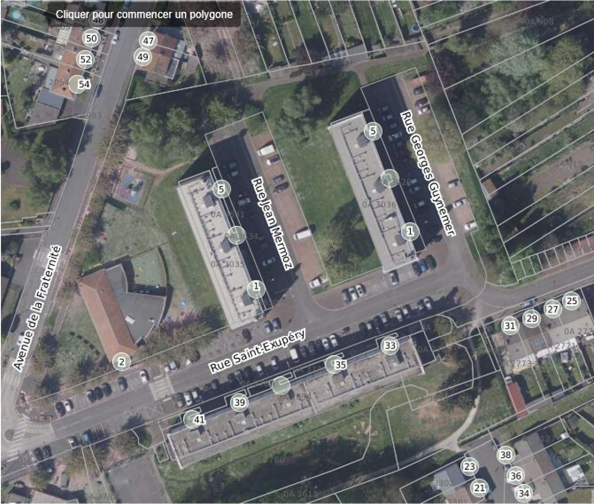
Exemple des délaissés objet de la vente au bailleur.